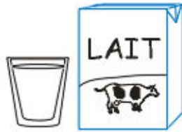
un verre de lait